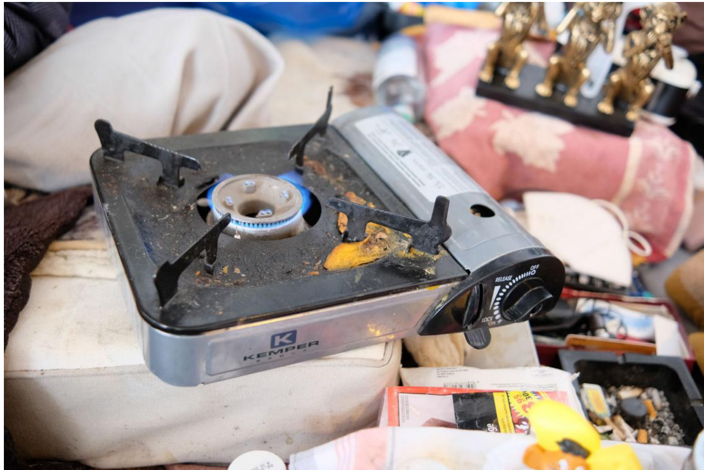
Gaskocher zum Wasser Wärmen und Suppe Kochen