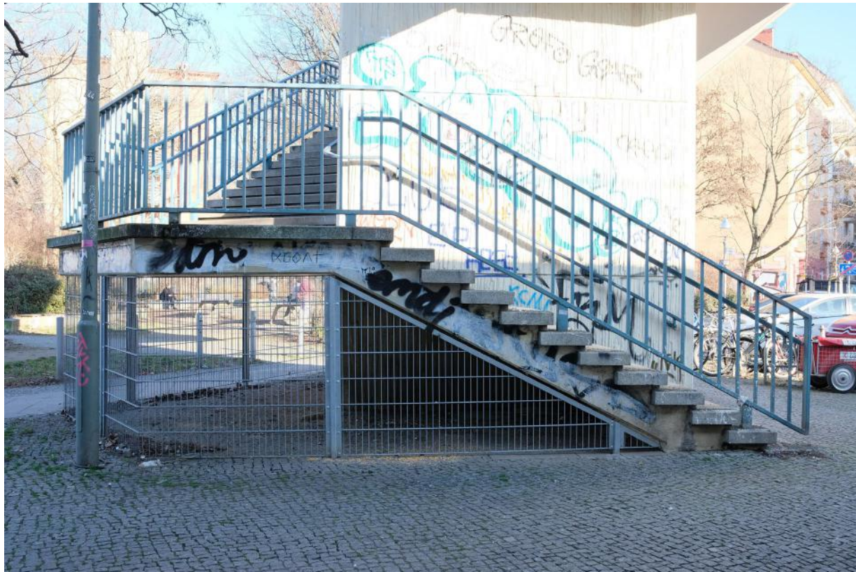
Nach Räumung abgesperrter Zugang