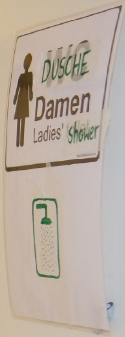
Dusche in Notunterkunft